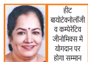
हीट बायोटेक्नोलॉजी व कम्प्युटेशनल जीनोमिक्स में योगदान पर होगा सम्मान