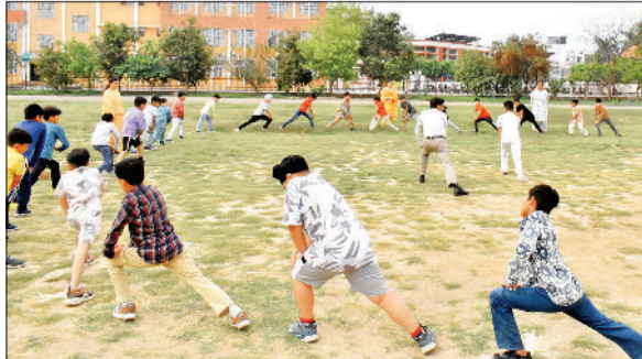
अंबाला। शिविर के दौरान कसरत करते छात्र।

अंबाला शहर स्थित पुलिस डीएवी पब्लिक स्कूल में आर्य समाज के स्थापना दिवस पर निशुल्क सात दिवसीय चरित्र निर्माण शिविर का शुभारंभ किया गया है। इस शिविर में लगभग 200 विद्यार्थी उत्साहपूर्वक भाग ले रहे हैं। क्रिकेट, स्केटिंग, बॉस्केट बॉल, कैरम, बॉक्सिंग, योगा, जिम्नास्टिक, कराटे आदि