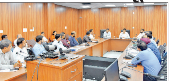
यमुनानगर। रबी सीजन की फसलों में बैठक में उपस्थित अधिकारी।

जिले में रबी सीजन की फसलों की खरीद को लेकर अधिकारियों की समीक्षा बैठक का आयोजन हुआ। बैठक की अध्यक्षता अतिरिक्त उपायुक्त नवीन आहूजा ने की। अतिरिक्त उपायुक्त नवीन आहूजा ने कहा कि रबी खरीद सीजन का कार्य एक अप्रैल 2026 से शुरू होने जा रहा है। उन्होंने संबंधित विभागों के अधिकारियों को निर्देश दिए कि वे समुचित रूप से सभी अनाज मंडियों में मूलभूत सुविधाओं का प्रबंध पहले से करवाना सुनिश्चित करें, ताकि किसानों को अपनी फसल