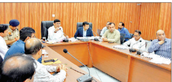
यमुनानगर। जिला सचिवालय में आयोजित बैठक में भाग लेते अधिकारी।

जिला सचिवालय में शुक्रवार को समाधान शिविर, जन संवाद, सीएम विंडो व एसएमजीटी में प्राप्त शिकायतों के निपटान को लेकर प्रशासनिक अधिकारियों की बैठक का आयोजन किया। बैठक में हरियाणा सरकार के प्रधान सचिव राजीव रंजन ने अधिकारियों को दिशा निर्देश दिए। रंजन ने कहा कि अधिकारियों द्वारा शिविरों में प्राप्त हर शिकायत को समयबद्ध ढंग से उसका समाधान करवाना सुनिश्चित किया जाए। उन्होंने अधिकारियों से समाधान