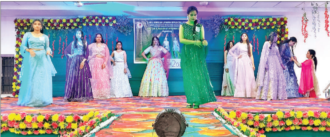
बराड़ा। फैशन शो में अपने हुनर का प्रदर्शन करते हुए कॉलेज छात्राएं।