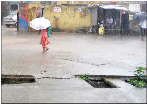
यमुनानगर। हल्की बारिश में भीगते हुए अपने गंतव्य पर जाते हुए राहगीर।

जिले में शुक्रवार को दिन भर रुक रुक कर बूँदा बांदी और हल्की बारिश होने से मौसम में ठंडक बढ़ गई। इस दौरान लोगों ने एक बार फिर गर्म कपड़े पहन कर ठंड से राहत की सांस ली। वहीं, किसानों ने बूँदा बांदी व हल्की बारिश होने से खेतों में पहले से नीचे बिछी गेहूं व सरसों की फसल में नुकसान होने की आशंका जताई है। किसानों के मुताबिक यदि इसी तरह आगे भी मौसम खराब रहा तो उनकी खेतों में बिछी गेहूं व सरसों की फसल को भारी नुकसान होगा।