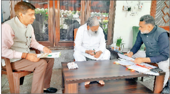
अंबाला। लंबित फाइलें निपटारते मंत्री अनिल विज।