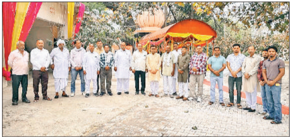
नारायणगढ़। मीटिंग में मौजूद भारतीय किसान संघ के सदस्य।

पर घरेलू गैस का उपयोग दिखाई दिया और टीम ने सात सिलेंडर जब्त किए हैं, इसके साथ ही इन दुकानों के मालिकों पर विभाग की तरफ से कार्रवाई की जाएगी। उन्होंने कहा कि प्रशासन की तरफ से सख्त निर्देश है।