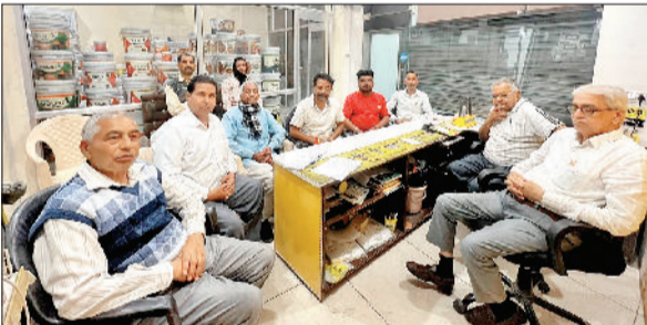
नारायणगढ़। बैठक करते आर्य समाज कॉलेज विभाग के सदस्य।

हासिल करने के लिए रणनीतियों पर भी विचार-विमर्श हुआ। इसमें तकनीक के अधिक उपयोग, वित्तीय समावेशन और ग्राहक-केंद्रित सेवाओं पर विशेष जोर दिया गया। सम्मेलन "विकासित भारत 2047 के विजन के अनुरूप एक डिजिटल रूप से सशक्त और विकासोन्मुखी बैंकिंग संस्थान बनाने की दिशा में अहम कदम माना जा रहा है।