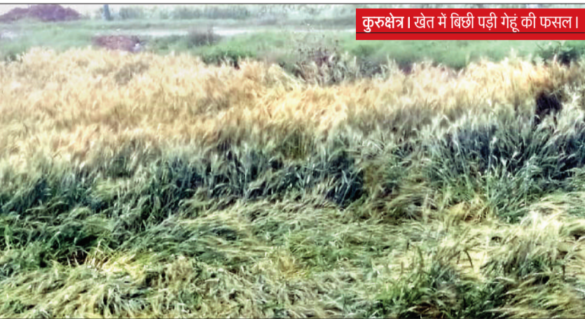
कुरुक्षेत्र। खेत में बिछी पड़ी गेहूं की फसल।

बारिश के साथ चली हवा ने खेतों खड़ी गेहूं की फसल को गिरा दिया। जमीन पर बिछी फसल का सीधा प्रभाव पैदावार पर पड़ेगा।