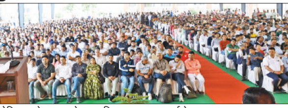
कुरुक्षेत्र। विद्यार्थियों को संबोधित करते गुरुजगत के महामहिम राज्यपाल आचार्य देवव्रत।

निभा रहा है क्योंकि गुरुकुल में बच्चों को अक्षरज्ञान के साथ-साथ विभिन्न क्षेत्रों की गतिविधियों से भी अवगत कराया जाता है। उन्हें प्राकृतिक खेती का प्रशिक्षण दिया जाता है, गुरुकुल की अत्याधुनिक गोशाला में पशुपालन की पूरी जानकारी दी जाती है। उन्होंने कहा कि आधुनिक शिक्षा प्रणाली अक्सर तनाव और अत्यधिक प्रतिस्पर्धा को बढ़ावा देती है, जबकि गुरुकुल शिक्षा एक संतुलित, मूल्य-आधारित और तनाव-मुक्त वातावरण प्रदान करती है। उन्होंने एक सशक्त और जिम्मेदार भविष्य पीढ़ी के निर्माण के लिए भारतीय परंपराओं से पुनः जुड़ने की आवश्यकता पर बल दिया।