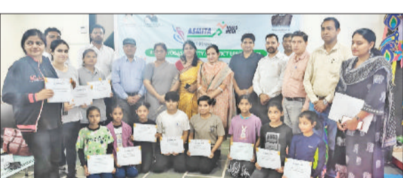
कुरुक्षेत्र। प्रतियोगिता के विजेताओं को सम्मानित करते अतिथिगण।